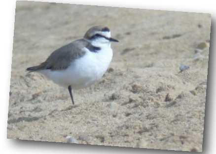
Gravelot à collier interrompu mâle