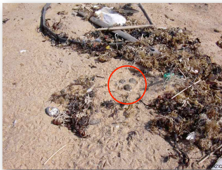
Nid de gravelot à collier interrompu dans la laisse de mer

La population de gravelot à collier interrompu est très vulnérable et le nombre d'individus tend à baisser chaque année, notamment à cause du dérangement en période de nidification. Conscients de ce phénomène, associations, communes, départements ou autres structures tentent de trouver des solutions. Parmi elles, réduire les nuisances des différents engins qui sont là pour nettoyer les plages, à l'heure où elles sont vides (enfin presque...). En effet, au moment du nettoyage automatique des plages, les poussins de gravelots ont la mauvaise habitude de se camoufler dans les traces des pneus des tracteurs... lesquels, voulant limiter leur impact sur les plages, reprennent leur trace au retour... Il vaut mieux préférer un nettoyage manuel, et donc, permettant de minimiser l'impact sur l'espèce.