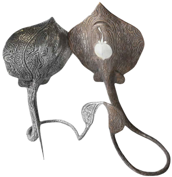
Gubuka par Dennis Nona

La raie est un très beau sujet pour les artistes, en voici la preuve.