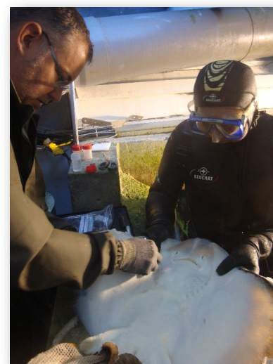
Prélèvement de mucus à l'aquarium marin de Trégastel

Nous remercions vivement tous les ramasseurs de capsules et le personnel de l'Aquarium de Trégastel.