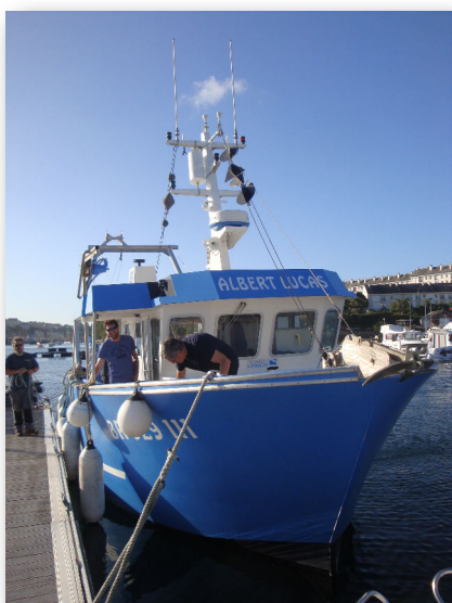
Le navire océanographique Albert Lucas

Un peu plus de 800 échantillons de tissu de raies bouclées issus de 13 secteurs géographiques d'Atlantique nord-est ont été rassemblés, ce qui couvre la majeure partie de l'aire de répartition de l'espèce. Ils permettront d'étudier la diversité et la structure génétique de la raie bouclée.