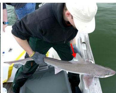
A. Ruy-Lords Of The Ocean